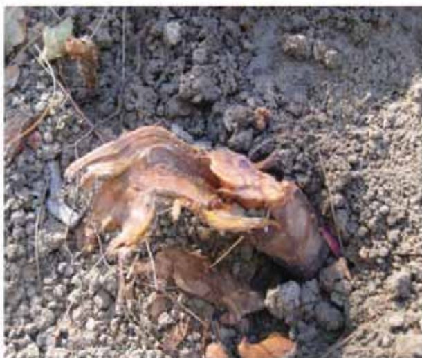
Pied de rosier coupé au sécateur.

Nous terminerons par des remerciements, aux rares personnes qui ont tenté de remettre en état la ou les jardinières à proximité de leur domicile. On pourrait se poser légitimement la question de la nécessité de maintenir des plantations d'agrément dans le village.