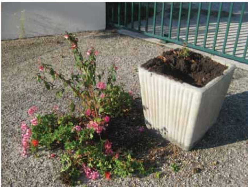
Même nos enfants n'ont pas été épargnés, ci-dessus les jardinières situées devant l'entrée de l'école.