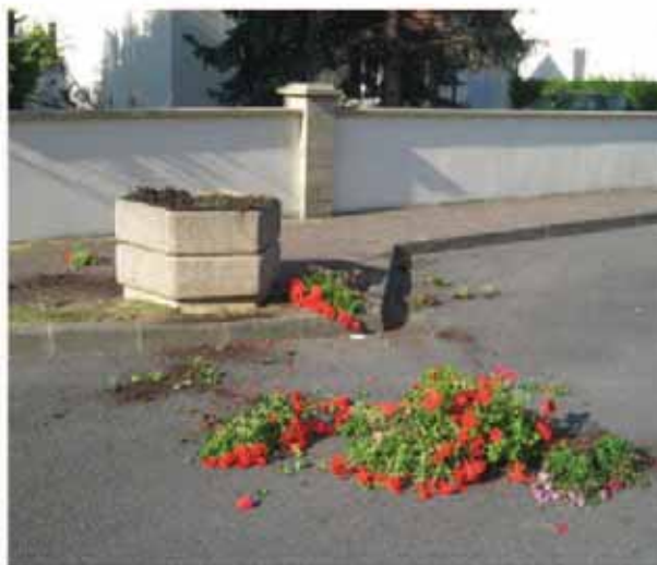
Une des multiples jardinières vandalisées